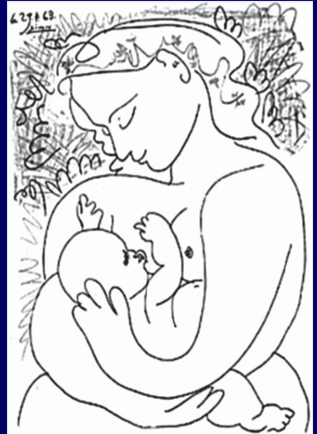
2003 Estate of Pablo Picasso/Artists Rights, New York