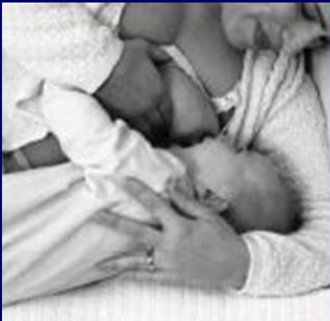
POSIÇÃO DE DEITADA