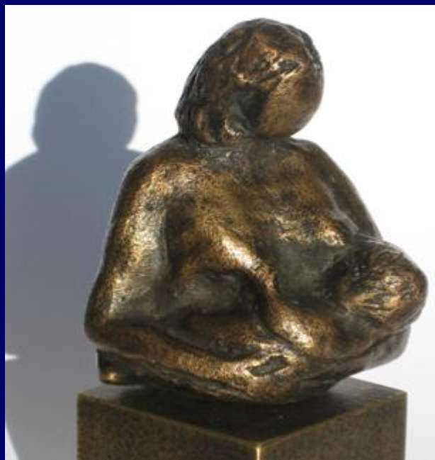
POSIÇÃO SENTADA (tradicional)